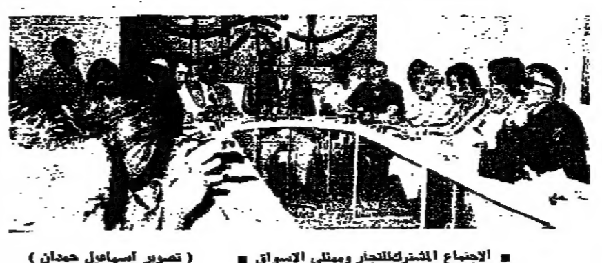
اجتماع مشتركة حضره ممثلو الاسواق